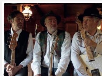
SNOW ON THE ROOF

Receptie, een heerlijke BBQ en animatie "Snow on the Roof" met pittige muziek uit de sixties die iedereen kent